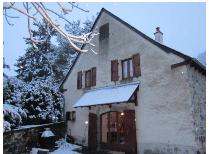
Surprise au réveil !! La neige est au rendez-vous.