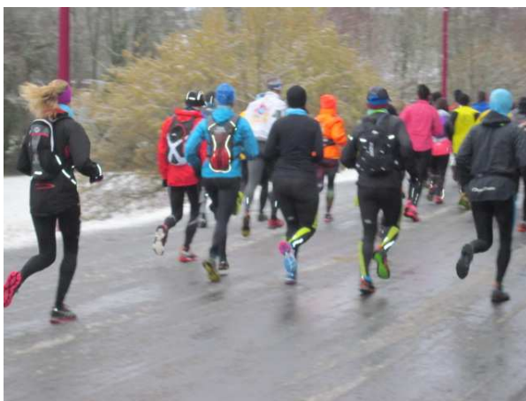
Retrouvez nos quatre athlètes !