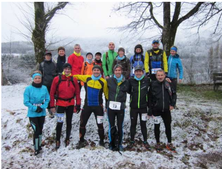
Photo de groupe avant le départ : 5 pour le 13 kms, 9 pour le 23 kms et 2 en randonnée.